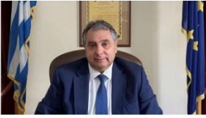
Β. Κορκίδης: Συνδυαστική ευκαιρία για το Πειραικό Επιχειρείν οι νεοφυείς επιχειρήσεις και η γαλάζια καινοτομία